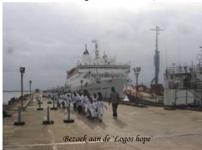
Bezoek aan de 'Logos hope'

Giften: Via rekeningnummer 35.30.05.738 van de zendingscommissie van de Hervormde Gemeente te Papendrecht t.n.v. Manneka (ANBI erkend)